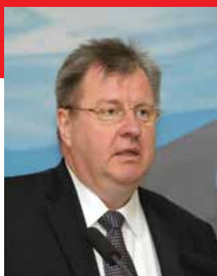
КУЦЬКО ПАВЕЛ ПАВЛОВИЧ

Директор Департамента радиоэлектронной промышленности Минпромторга России