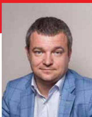
ШПАК ВАСИЛИЙ ВИКТОРОВИЧ

Директор Департамента радиоэлектронной промышленности Минпромторга России